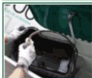
Lavadoras de piezas Hidrolavadoras